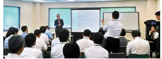
働き方改革研修風景

私たちは、働き方改革とは「幸せで豊かな人生」のために欠くべからざるものと考えます。そのためにWLBCプロ集団として「業務を効率化して働く時間を短く」「働く人すべての生活環境に配慮したマネジメント」「経営課題解決のためのWLB推進」等を力強く進めて参ります。